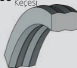
A406 Statik Sızdırmazlık Keçesi