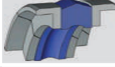
A111 Piston Keçesi