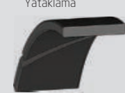
A251 Piston Boğaz Yataklama