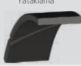
A251 Piston Boğaz Yataklama